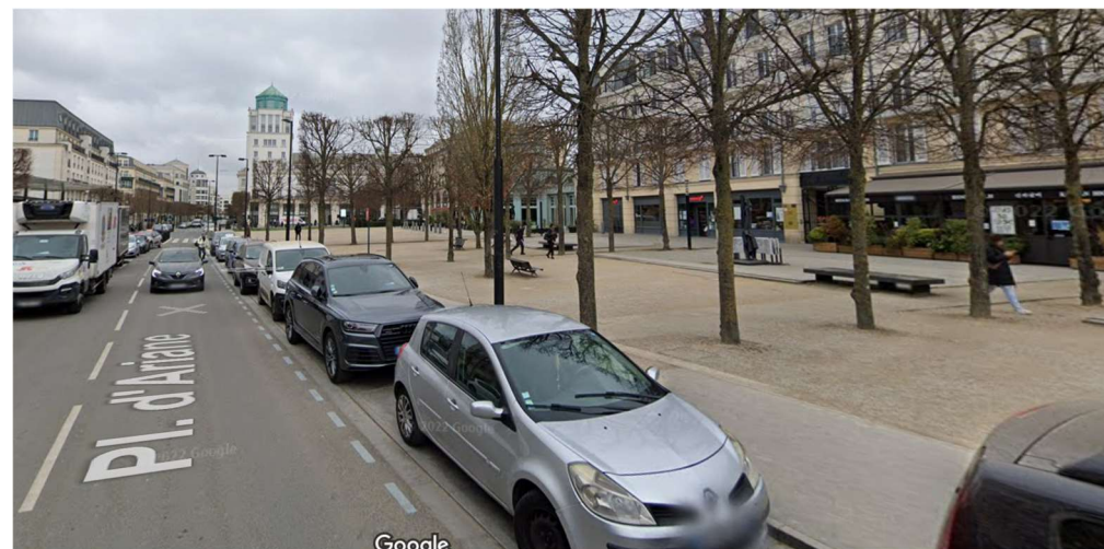
Place d'Ariane (RER A Val d'Europe), située à 500 mètres de la résidence

Il s'agit de faciliter le partage de temps collectifs entre les personnes de la résidence et de favoriser les relations avec les habitants et commerces du quartier.