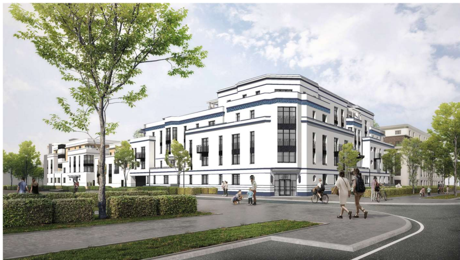
rue du Pré Verson, à Chessy